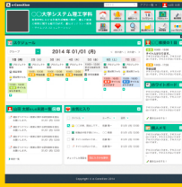
※画像はイメージです。デザインは変更となる場合がございます。