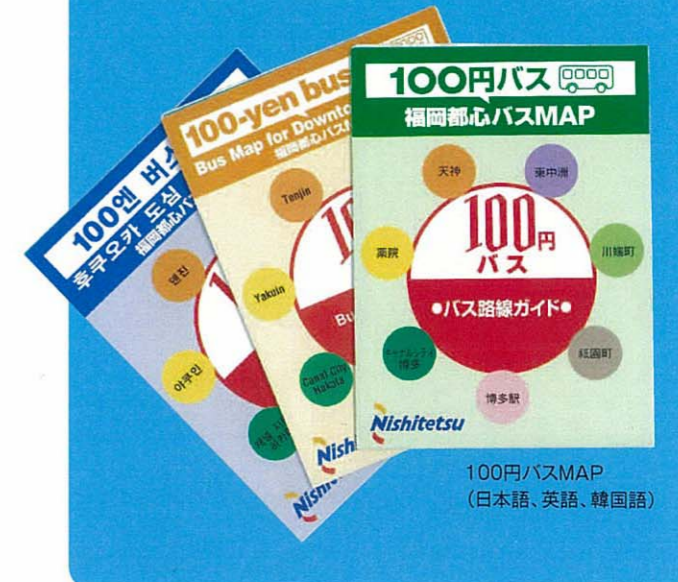
100円バスマップ (日本語、英語、韓国語)