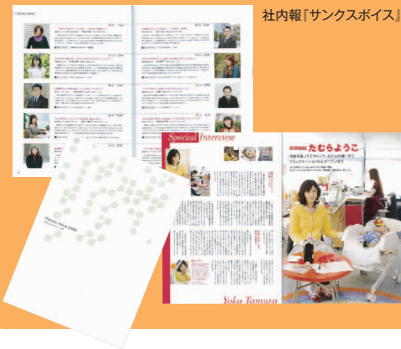
社内報「サンクスボイス」

西日本エリアにおける116センター、104センター(沖縄を除く)を運営するとともに、各企業様に『最高の顧客コンタクト』をご提供できるコンタクトセンターを運営。企業の方針を社員に的確に伝え、スタッフ間のコミュニケーションを向上させる手段として、社内報を制作。西日本を業務エリアとするNTTマーケティングアクトの社内啓蒙ツールを、タウン情報全国ネットを介した制作体制で実施しました。