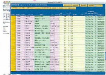
フリーペーパー「fuge」制作用のデータベース