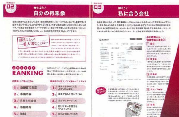
就活ガイドブック

《シティ情報ふくおか》ではツール制作の一環として多くの会社案内を手がけています。また、アプライドでは、自社の求人活動を通して、学生の就職活動を応援するツールやイベントを行なっています。これらを組み合わせることで、より効果的な認知度アップや求人活動が行えます。