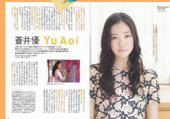
パンフレット「タブレット」