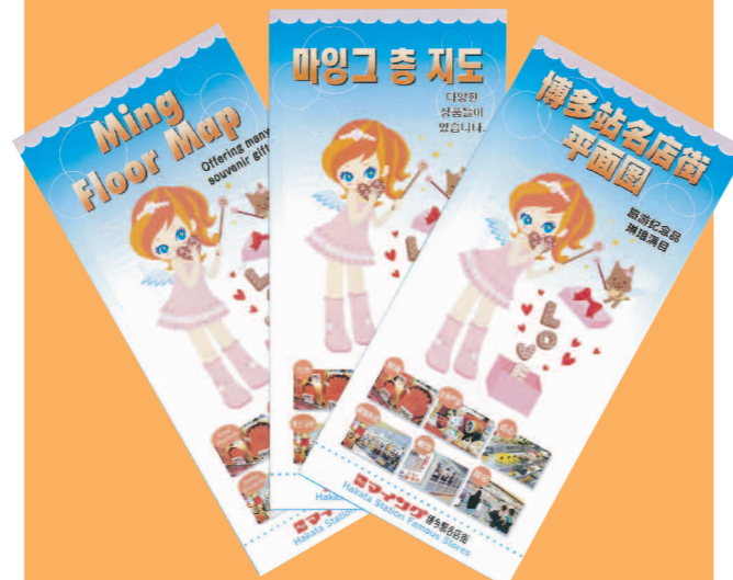
フロアマップ(中国語、韓国語、英語)