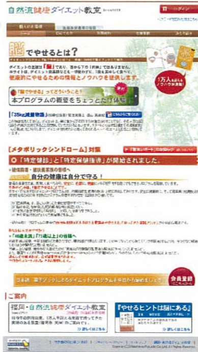
自然流健康ダイエット教室様(会員サイト)

コーポレートサイト、ポータルサイト、ECサイト、会員制サイトなど様々なサイトの制作を承っています。御社のブランディング、販売チャンスの拡大、求人募集の案内等、ホームページの企画・制作により、強力にビジネスをサポートします。