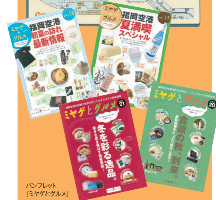
パンフレット 「ミヤゲとグルメ」