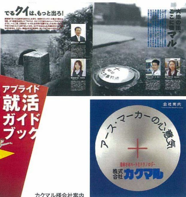
カクマル様会社案内