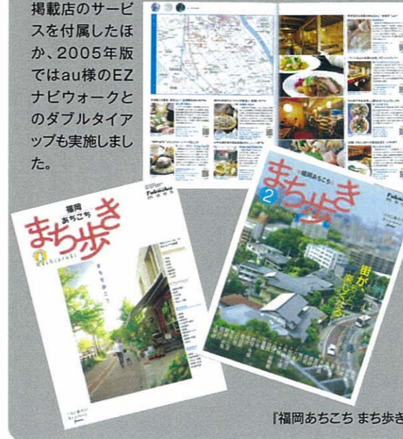
「福岡あちこち まち歩き」

西鉄バスの「バスに乗ろう!キャンペーン」とのタイアップ企画として、《福岡あちこち まち歩き》を発行。バスカード掲示による掲載店のサービスを付属したほか、2005年版ではau様のEZナビウォークとのダブルタイアップも実施しました。