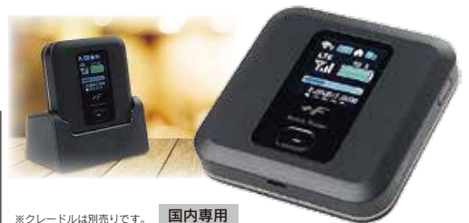
※クレードルは別売りです。国内専用

対応通信方式:LTE/3G LTE:受信時最大 150Mbps/送信時最大 50Mbps 無線LAN:IEEE802.11a/b/g/n/ac 連続通信時間:無線LAN通信 最大約20時間 無線LAN同時接続数:15台 サイズ:74×74×17.3mm 質量:約128g