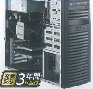
サイズ(mm) W193xD526xH424 ※キーボード・マウス付属 モニタ別売

Xeon E5 V2 2600/1600 最大1基 最大256GB(32GBx8)Registered ECC 80PlusGOLD 900W電源 超静音仕様