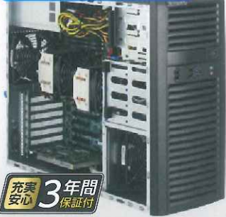
サイズ(mm) W193xD526xH424 ※キーボード・マウス付属 モニタ別売

Xeon E5 2600 V3 最大2基 最大512GB(32GBx16)Registered ECC 80PlusGOLD 900W電源 超静音仕様