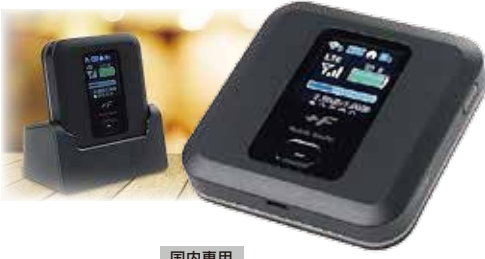
*クレードルは別売りです。国内専用

対応通信方式:LTE/3G LTE:受信時最大 150Mbps/送信時最大 50Mbps 無線LAN:IEEE802.11a/b/g/n/ac 連続通信時間:無線LAN通信 最大約20時間 無線LAN同時接続数:15台 サイズ:74x74x17.3 mm 質量:約 128g